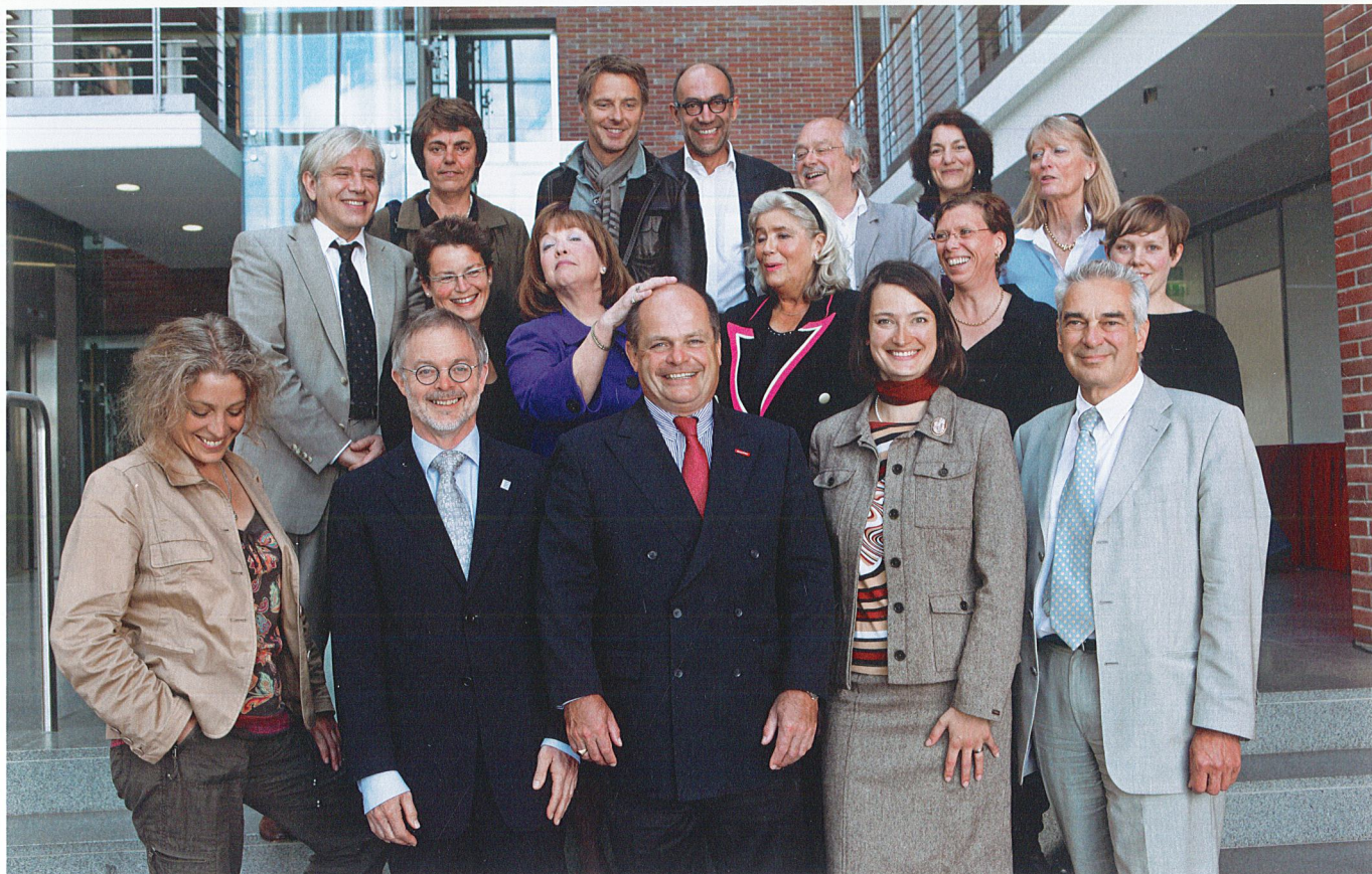
Viel Arbeit und gute Laune bei der Jurysitzung: Die Qualität der Projekte hat überzeugt.